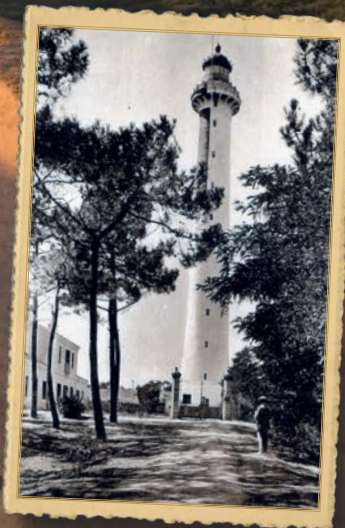
Phare en béton

Construction du phare actuel, en béton, à 1,8 km du rivage et allumé le 1 er octobre 1905.